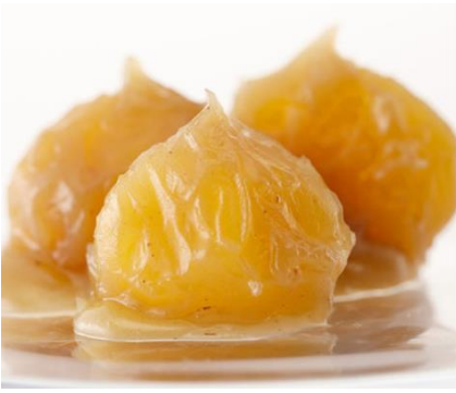
※写真は小布施堂の名物、栗鹿ノ子です